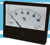
BM-86A tampa acrílica